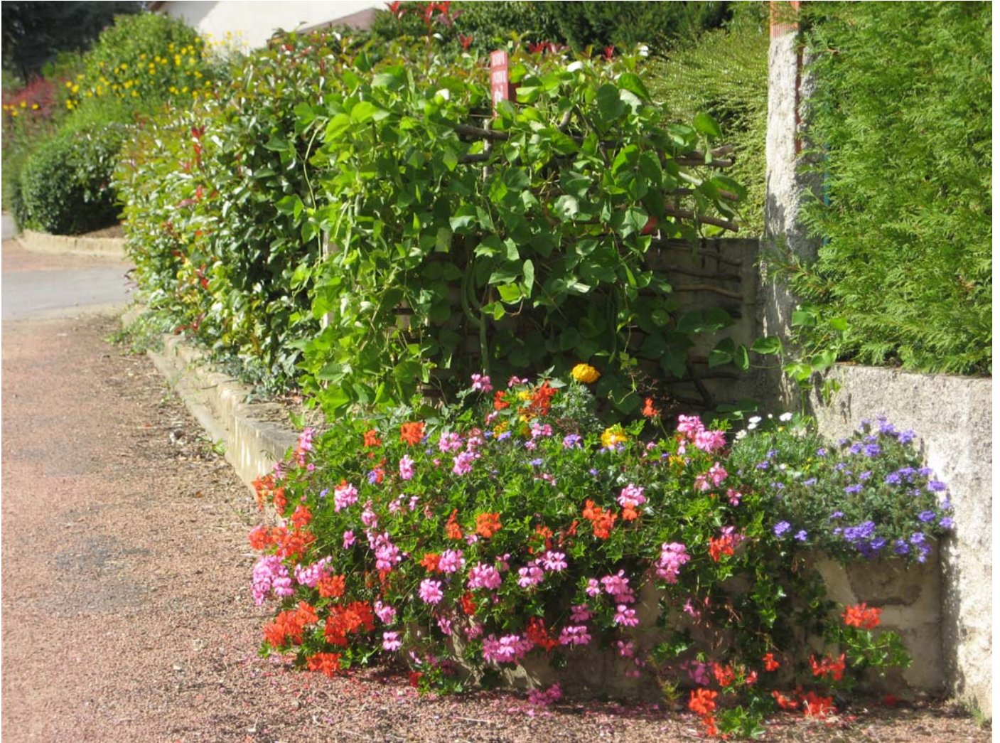
Rue de la Bernardie